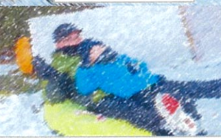
お父さんも楽しみました!